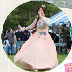
テガヌマンクート